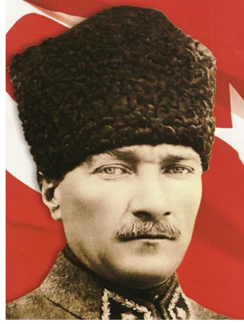
Mustafa Kemal ATATÜRK